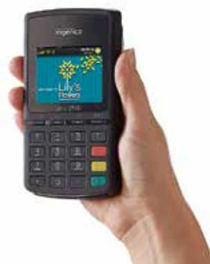
手のひらに収まるコンパクトサイズ